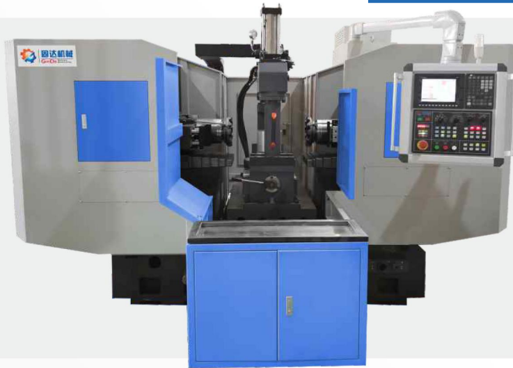
強力油圧シリンダー Powerful hydraulic cylinder